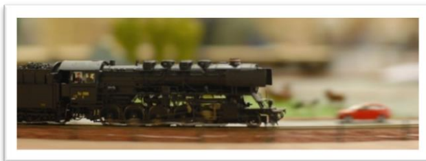
Fuld damp på