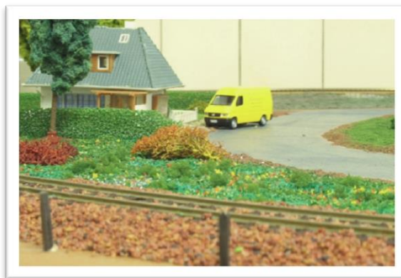
Udsnit fra et modul

Vi har en modelbane i konstant udvikling. Fordi vi bygger i moduler, er vores modelbane aldrig færdigbygget. Vi kan hele tiden sætte nye moduler ind, eller skifte dem ud. På den måde får vi en "levende" modelbane, der ændrer sig fra gang til gang.