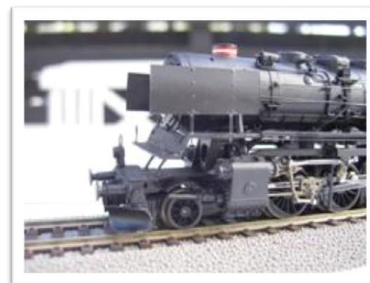
Ombygget Litra N

Klubben har ikke noget rullende materiel. Det har vores medlemmer derimod og det står dem frit for at køre med det på klubbens anlæg. Derfor går klubbens midler udelukkende til opbygning af banen.